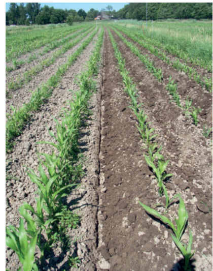
Abb. 11: Rechts ist die gute Verschüttung der Unkräuter durch das Häufeln zu erkennen.

erfolge erzielen lassen und der Mais das Häufeln auch gut verträgt (Abb. 10 und 11). Zudem bewirkt das Häufeln eine bessere Erwärmung des Bodens, was wiederum zur Nährstoffmobilisierung führt und somit schlussendlich das Maiswachstum verbessert. Wenn entsprechende Ausbringungstechnik zur Verfügung steht, kann vor dem Häufeln eine Gülle- oder Gärrestgabe in den wachsenden Bestand ausgebracht werden, die anschließend mit dem Häufeler nah zu den Maiswurzeln eingearbeitet wird. Um bei der späteren Maisern-