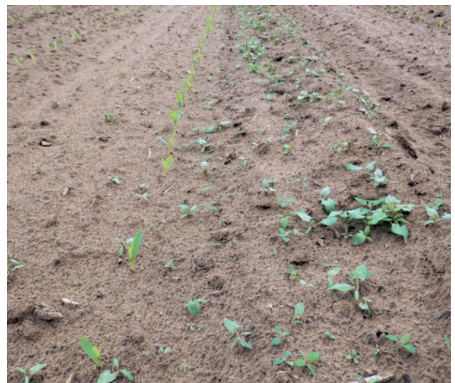
Abb. 3: Linke Bildhälfte: zweimaliger Striegeleinsatz im Voraufbau; rechte Bildhälfte: ohne Striegeln.