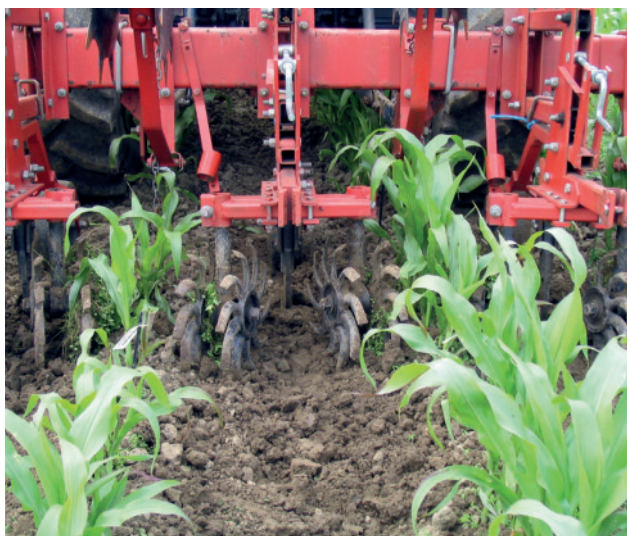
Abb. 9: Später Einsatz der Rollhacke mit leicht häufelnder Wirkung.

schonung überraschend gut. Für Sandböden ist die Sternrollhacke weniger geeignet, da kaum zusammenhängende Bodenteile herausgebrochen werden. Bei wiederholten Überfahrten arbeitet die Maschine zu tief, wodurch Schäden am Mais und Wuchsbeeinträchtigungen entstehen können. Zur Tiefenbegrenzung sollten Stützräder an der Sternrollhacke vorhanden sein.