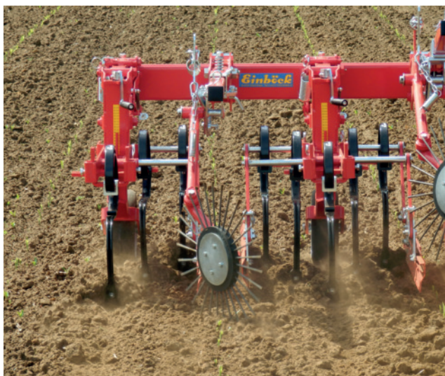
Abb. 8: Scharhacke mit Rollstriegel.