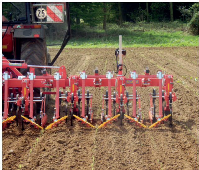
Abb. 7: Scharhacke mit Fingerhacke/hochgestellt, da der Mais noch zu klein ist.