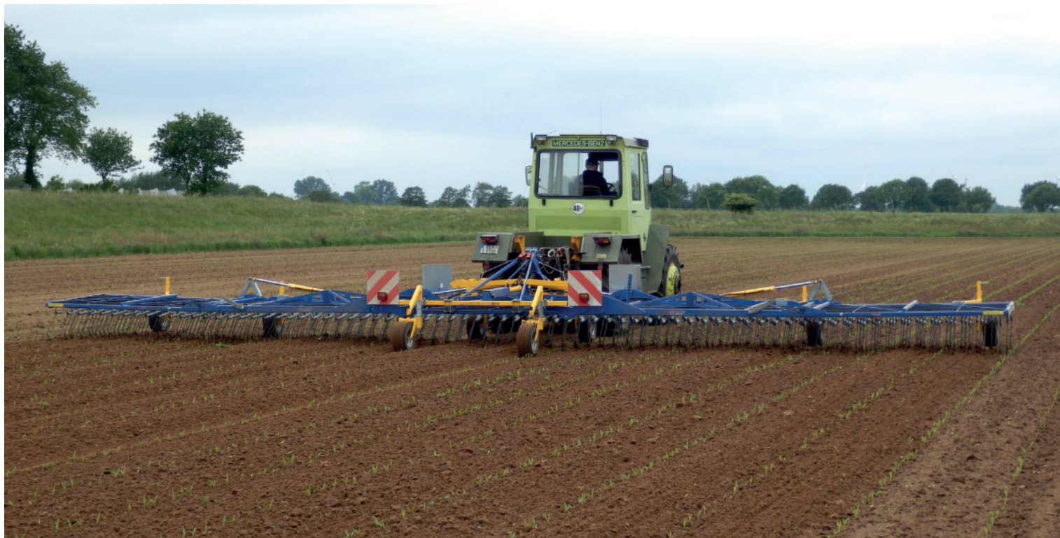
Striegeln im Nachauflauf (im frühen 2-Blatt-Stadium (BBCH 11/12) der Maispflanzen).