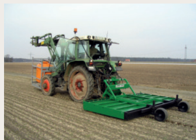
Abb. 12: Abflammentechnik im Voraufbau.

Der Fachbereich Ökolandbau der LWK Niedersachsen hat die Möglichkeiten der thermischen Regulierung im Nachaufbau des Maises in dreijährigen Versuchen getestet (Abb. 12). Die Auswertung ist noch nicht vollständig abgeschlossen. Die vorläufigen Ergebnisse zeigen aber, dass ein Abflammen der Unkräuter im Einblattstadium (BBCH 11) der Maispflanzen problemlos möglich ist. Die jungen Maispflanzen regenerieren sich vergleichsweise schnell. Auch spätere Abflammenterme wurden getestet, ohne dass zuvor eine mechanische Regulierung nach der Maissaat erfolgte. Hier zeigte sich, dass noch bis zum Zweiblattstadium (BBCH 12) abgeflammt werden kann. Vorausgesetzt, dass nach dem Abflammen eine warme Witterungsphase vorherrscht, damit der Mais sich wieder zügig regeneriert. Der große Vorteil des Abflammens ist, dass bis zu dessen Durchführung weder gestriegelt noch gehackt wird. Zudem reichten nach den Abflammen ein bis zwei Durchgänge mit der Scharhacke bis zum Reihenschluss aus. Nach Abschluss der Versuchsauswertung wird detaillierter über die Ergebnisse berichtet.