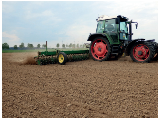
Abb. 5: Die Sternrollhacke erfordert eine hohe Arbeitsgeschwindigkeit und lockert sehr gut und pflanzenschonend verkrustete Böden.

den einstecken, wird eine krustenbrechende und lockernde Wirkung erreicht (Abb. 5). Die Sternrollhacke erreicht somit ihre Stärke besonders auf verschlammten, verkrusteten, lehmigen Böden. Ein positiver Nebeneffekt ist bei diesen Bedingungen die Belüftung des Bodens, was das Pflanzenwachstum fördern kann. Durch ihre Arbeitsweise werden Unkrautpflanzen vorrangig gelockert und teilweise auch entwurzelt. Allerdings kommt die Sternrollhacke mit einer Überfahrt häufig nicht an den Regulierungserfolg eines Zinkenstriegels heran. Mit einem nachfolgenden Einsatz eines Striegels lassen sich aber in den vorgelockerten Boden gute Regulierungserfolge erzielen. Zu fahren ist die Sternrollhacke mit vergleichsweise hohen Geschwindigkeiten zwischen 15 bis 20 km/h. Trotz dieses hohen Tempos ist die Kultur-