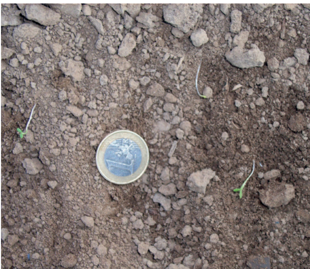
Abb. 2: Unkräuter im Keimblattstadium: Idealer Einsatztermin für den Striegel.

Der Mais ist striegelempfindlich, wenn der Keimling kurz vor dem Durchstoßen der Bodenoberfläche ist bzw. sich bereits