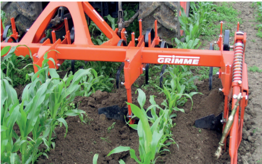
Abb. 10: Perfekte Verschüttung der Unkräuter mit dem Kartoffelhäufeler.

Im Maisanbau hat sich außerdem die Rollhacke bewährt. Sie kann je nach Werkzeugeinstellung sowohl von der Maisreihe „weghäufeln“ als auch zur Reihe häufeln (Abb. 9).