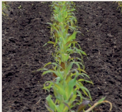
Die Kombination von Bandspritze und Hacke kann die Herbizidmenge reduzieren.

Ins Gewicht fallen jedoch die Anschaffungskosten der neuen Technik oder die Kosten für die Arbeit durch einen Lohnunternehmer. Der Zeitaufwand für die Überfahrt ist bei der Bandspritze höher als bei einer Flächenspritze. Während die Flächenspritze auf größeren Betrieben mit 24 m breitem Gestänge mindestens 7 km/h schnell fährt, wird eine Hackma-