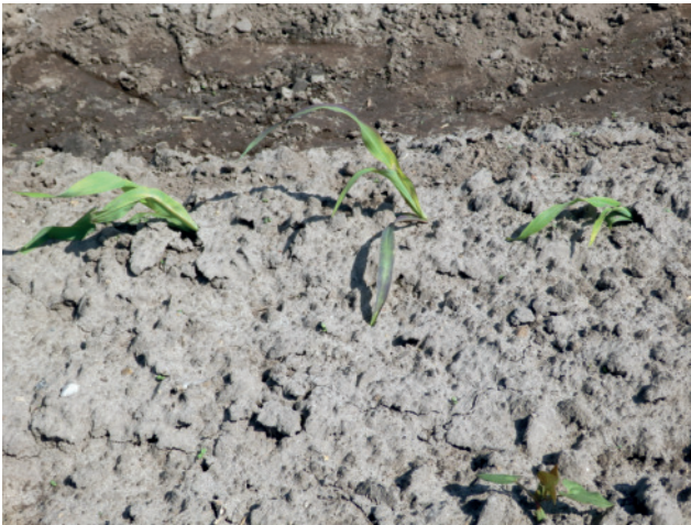
Abb. 4: Bei Striegeleinsätzen im Nachauflauf ist darauf zu achten, dass die Maispflanzen nicht durch eine zu hohe Arbeitsgeschwindigkeit verschüttet oder schräg gestellt werden.

im Aufgang befindet. Die Striegelverträglichkeit verbessert sich ab dem 1. Laubblatt (BBCH 11) des Mais. In dieser Phase muss mit reduzierter Arbeitsgeschwindigkeit und ggf. weicherem Striegelzinkendruck gearbeitet werden. Grundsätzlich ist das Striegeln auf die Nachmittagsstunden zu legen, da dann die Maispflanzen elastischer sind und nicht so schnell abbrechen.