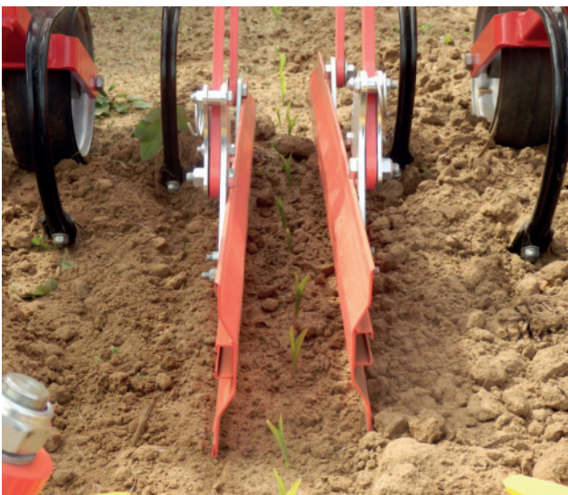
Abb. 6: Frühes Hacken im BBCH 11 mit Schutzblechen.